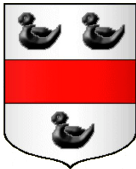
Wappenschild der Familie d'Esparbes de Lussan

Das 'offizielle' Wappen Lamothe-Cadillac ist im "Belgian Armorial Universel" (Hrsg. Koller & Schillings) beschrieben, so wie es 1687 in Quebec aufgezeichnet wurde. Es ist geviertelt, wobei das obere linke und untere rechte Viertel auf silbernem oder goldenem Grund je drei 'Merlettes' zeigen, geteilt durch einen schwarzen Balken. Das obere rechte und untere linke Viertel selbst ist wieder jeweils geviertelt, oben links und unten rechts rot und oben rechts und unten links je drei blaue Streifen auf silbernem Grund. 1