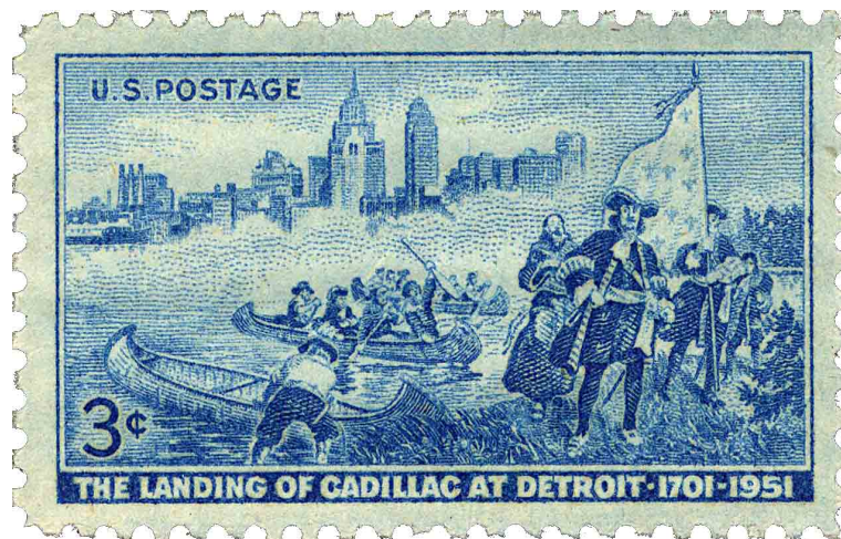
Briefmarke zum 250-Jahr Jubiläum der Gründung Detroits

Vaudreuil entgegnete, Cadillac und seine zwei Verbündeten hätten nicht das Wohlergehen der Kolonie Detroit im Sinn, sondern seien lediglich daran interessiert vom Pelzhandel zu profitieren. Ausserdem planten sie auch vom Schmuggel zu profitieren. Dies sei der Grund Cadillacs, Gouverneur seines Befehlsbereichs werden zu wollen, damit er dann, ohne dass man ihn zur Rechenschaft ziehen könne, mit den Engländern Handel