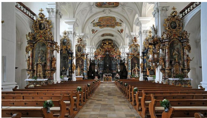
Innenbereich der Kirche