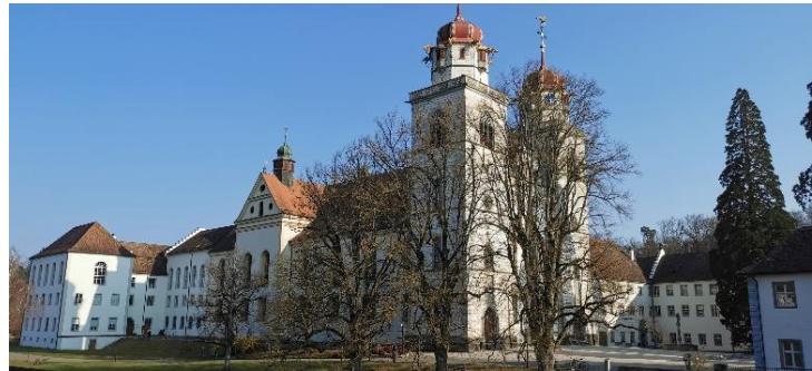
Aussensicht der Klosterkirche

Nebst dem gemütlichen Treffen zu Kaffee und Gipfeli empfehle ich euch sehr, die Zeit auch für einen Morgenrundgang zu nutzen auf der einzigartigen Klosterinsel mit der sehr eindrücklichen Klosterkirche und den wunderschönen, mächtigen Sequoia-Bäumen auf dem Vorplatz der Kirche. Ein Muss ist die Besichtigung der Klosterkirche Rheinau ab 10:30 Uhr. Nach Beendigung der Messe, welche von 09:30 bis 10:30 Uhr dauert, ist die Kirche frei zugänglich. Die barocke Klosterkirche Rheinau, eingeweiht anno 1710, zählt zu den absolut schönsten Barockkirchen der Schweiz.