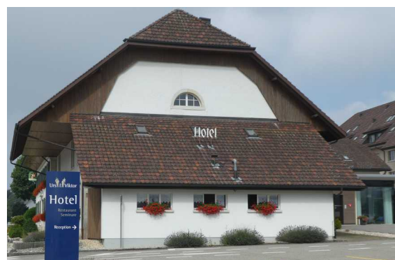
von Osten (Solothurn) her kommend