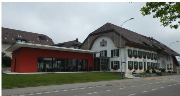
von Westen her kommend

Am Sonntag, 23. September 2018 werden wir im Hotel Restaurant Urs & Viktor , Solothurnstrasse 35 in 2544 Bettlach , ab 09:30 Uhr , zu einem ausgiebigen, reichhaltigen Brunch auf der grossen Gartenterrasse und/oder im Frühstücklokal erwartet.