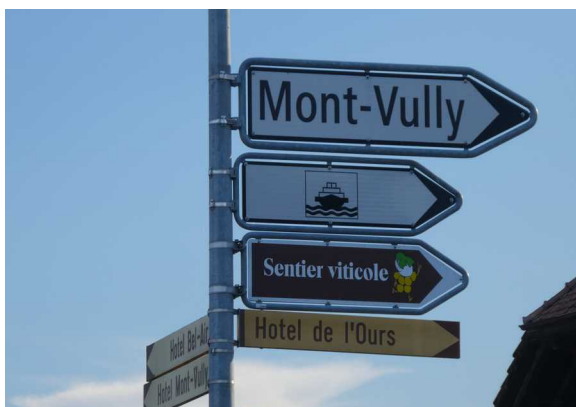
Wegweiser bei der MIGROL-Tankstelle in Sugiez.

Um 15:30 Uhr werden wir im Romantik Hotel de l' Ours in Sugiez eintreffen. Dort erwartet uns ein feines Essen ; je nach Witterung auf der Gartenterrasse im Schatten der Bäume oder alternativ im grossen Festsaal im 1. Stock.