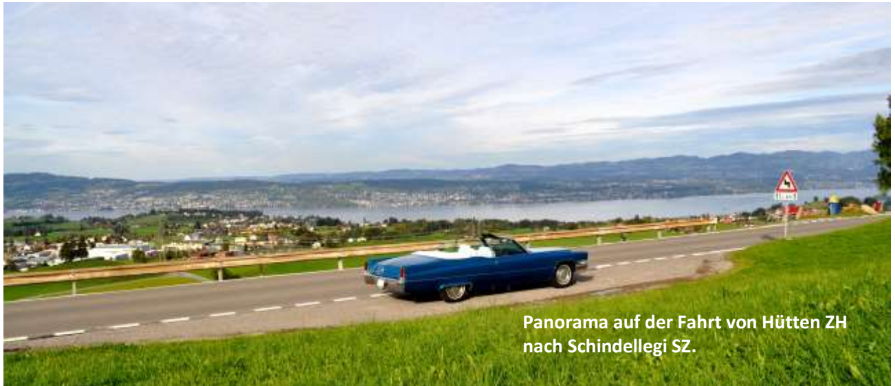
Panorama auf der Fahrt von Hütten ZH nach Schindellegi SZ.

Die Fahrt führt weiter hinauf zum Restaurant Büel am Fusse des Etzel, wo uns ein feines Mittagessen erwartet. Von dort aus genießt man eine atemberaubende Aussicht über den gesamten Zürichsee. Während dieser Zeit vergnügen sich unsere in Reih‘ und Glied aufgestellten Fahrzeuge geduldig auf einem für uns extra reservierten Parkplatz.